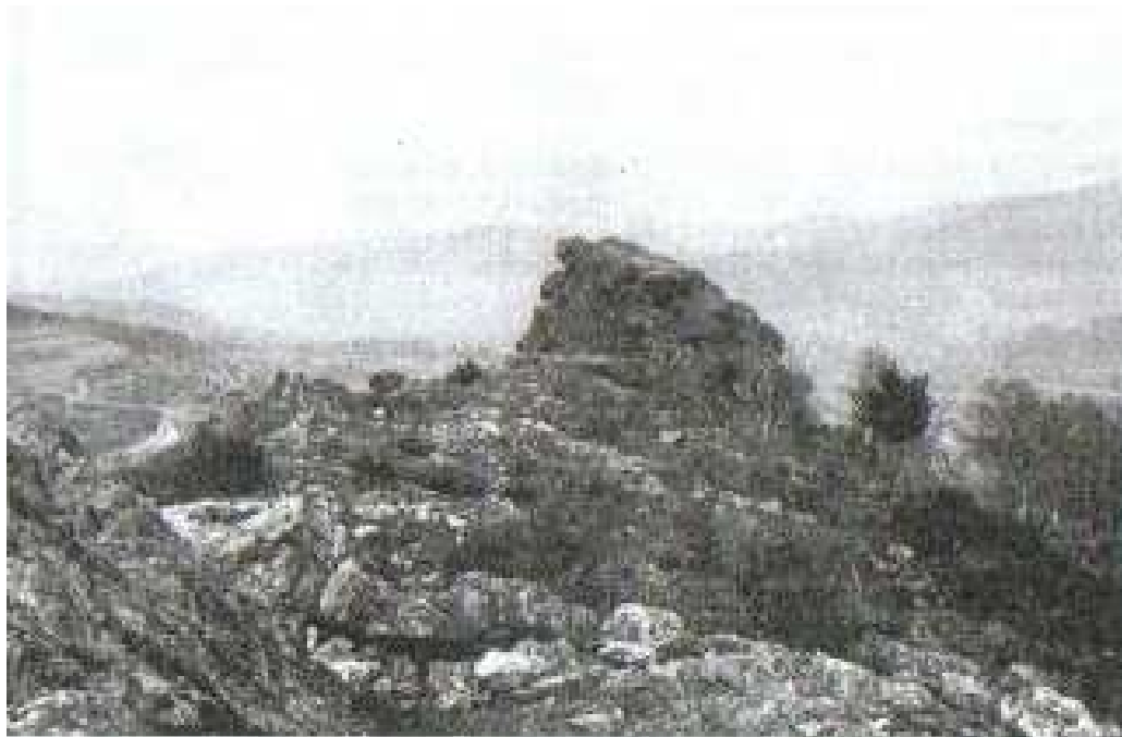
So sah der Immenstein damals aus

DER HERR GEBE IHNEN ALLEN SEINEN HIMMLISCHEN F R I E D E N