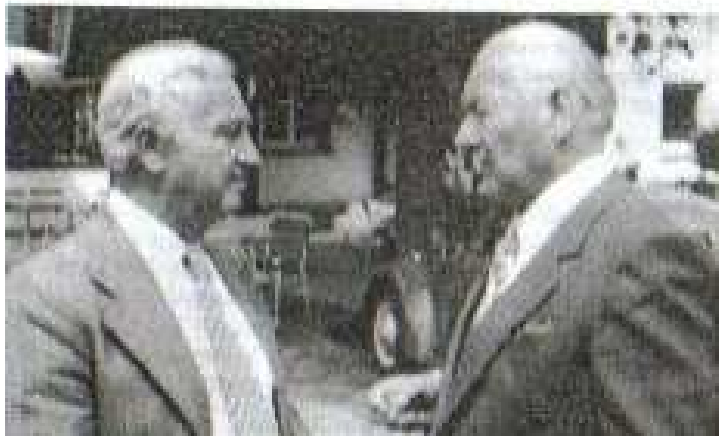
Bürgermeister Kist im Gespräch mit mir

Immenstein und Bühl mit Neusatz freund-kameradschaftlichst verbunden in alle Zeit